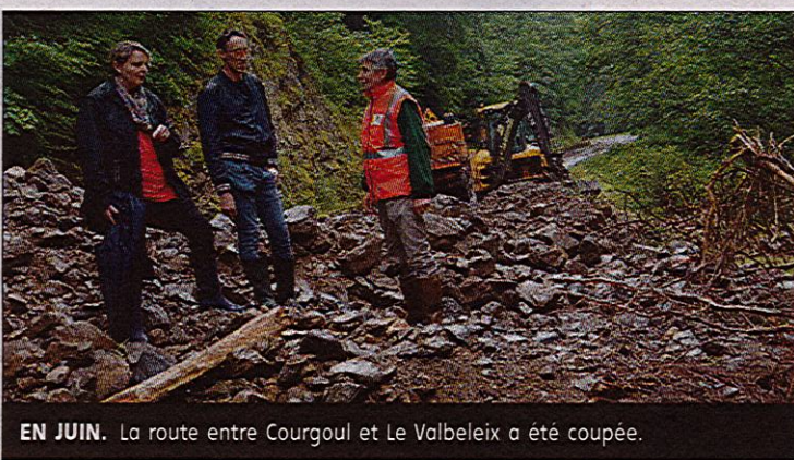
EN JUIN. La route entre Courgoul et Le Valbeileix a été coupée.

Les communes d'Égliseneuve-des-Liards, Montmorin, Courgoul, Montaigut-le-Blanc, Orléat, Saint-Floret et Saurier bénéficient d'une reconnaissance de l'état de catastrophe naturelle pour des phénomènes