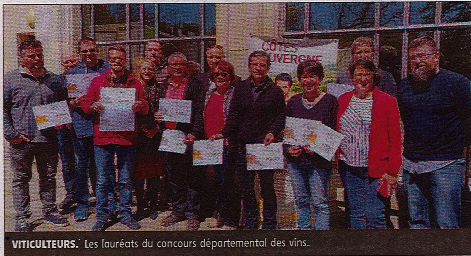
VITICULTEURS. Les lauréats du concours départemental des vins.

« La puissance touristique de l'ancienne région Auvergne n'est plus à démontrer. Il y a chez nous des produits locaux à déguster, des fromages bien sûr, mais aussi des vins », a rappelé en substance Yvan Bernard, président du syndicat AOC côtes-d'auvergne, avant de dévoiler le programme de la saison œnotouristique 2019 avec deux nouveautés : un Festi Wine et la volonté de décrocher le label « vignoble et découverte ».